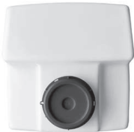
Aufsicht BD-A 250