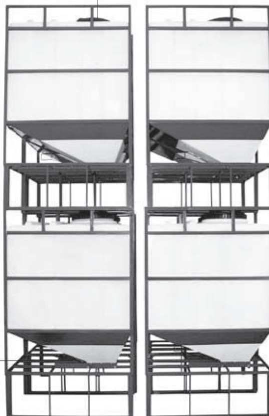
Container PTA 11/P im Batteriestell

inklusive Schieber, Stahl pulverbeschichtet